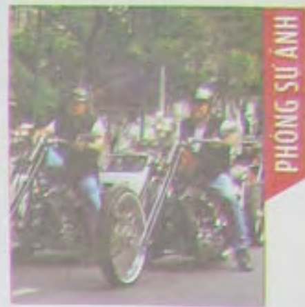
PHONG SỰ ANH

TRUNG TÂM XÚC TIẾN THƯƠNG MẠI VÀ ĐẦU TƯ THÀNH PHỐ HỒ CHÍ MINH