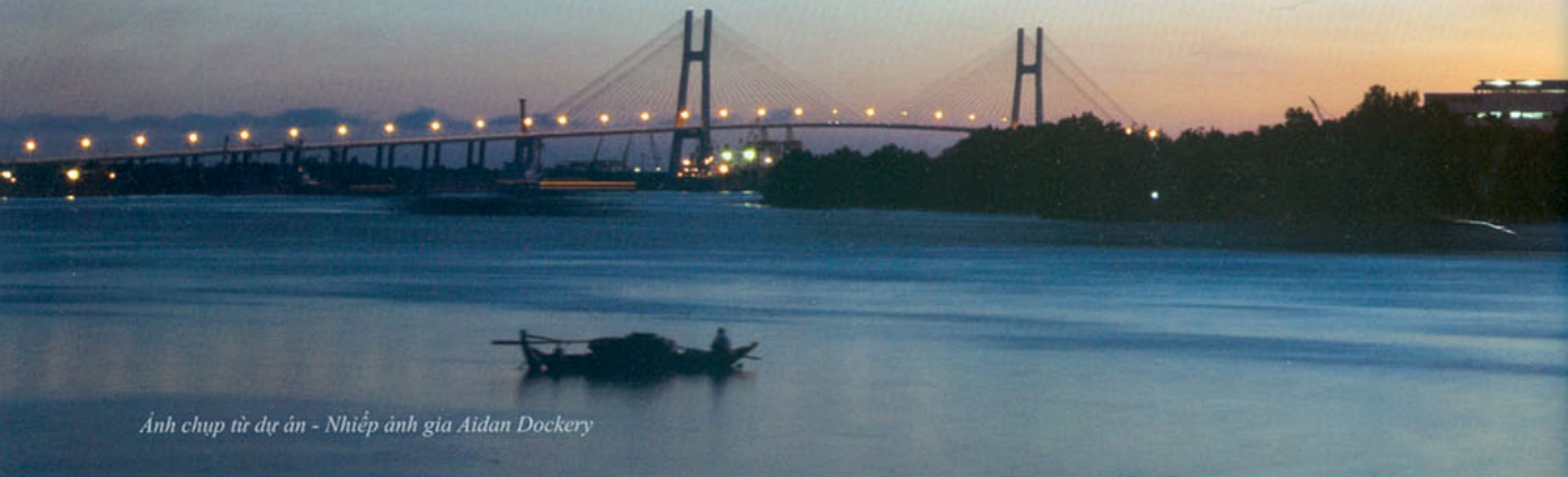
Ảnh chụp từ dự án - Nhiếp ảnh gia Aidan Dockery

Nằm ở ngã ba sông Sài Gòn thơ mộng, Đảo Kim Cương, ốc đảo thanh bình, nguyên sơ, tách biệt những ồn ào náo nhiệt của thành phố là điểm đến sang trọng và lý tưởng hàng đầu của cuộc sống nghỉ dưỡng.